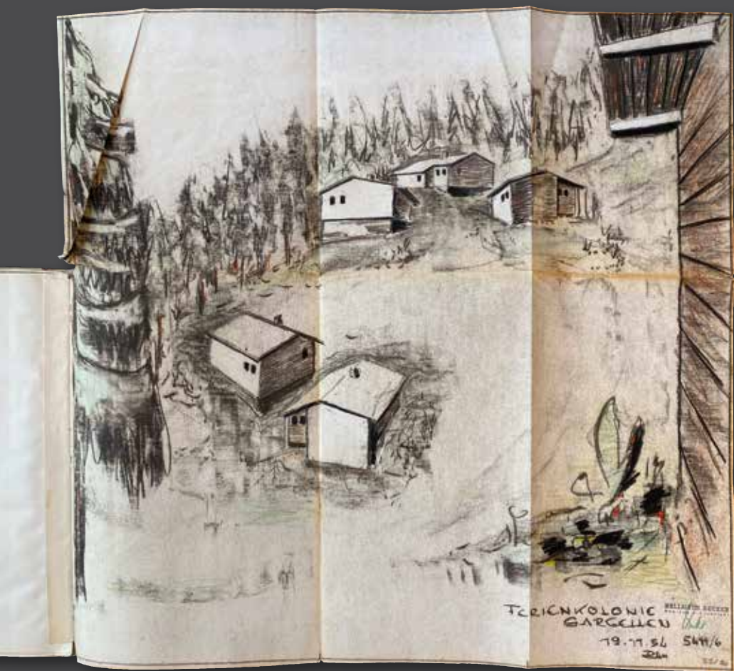
Skizze der Ferienkolonie Gargellen, 24. November 1954