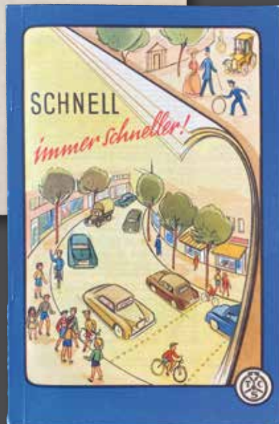
Das veröffentlichte Buch „SCHNELL immer schneller!“