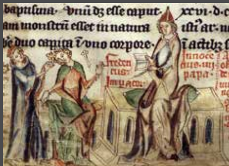
Darstellung der Exkommunikation Kaiser Friedrichs II. durch Papst Innozenz IV.