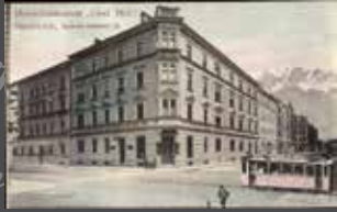
Hotel-Restaurant „Österreichischer Hof“ in Innsbruck