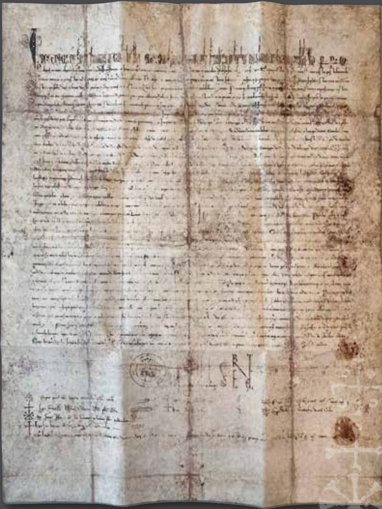
Urkunde von Papst Innozenz IV., 17. September 1249