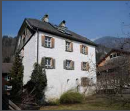
Das Gebäude in Bezau heute