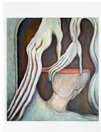
Untitled (touch another surface please!)