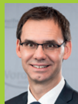
Mag. Markus Wallner Landeshauptmann

Egal, ob Sie mit Ihrer Familie Berge erklimmen, im Wasser planschen oder kreative Momente genießen möchten – der Sommer hält für jeden Geschmack etwas bereit! Wir wünschen Ihnen unvergessliche Ferien voller Abenteuer und Spaß mit dem Familienpass!