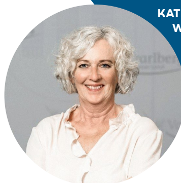
KATHARINA WIESFLECKER Frauenlandesrätin

Ein Blick in andere Länder – in die USA, nach Ungarn oder Polen – zeigt aber auch, dass die erkämpften Selbstbestimmungsrechte der Frauen keine Selbstverständlichkeit sind. Daher müssen wir wachsam sein und gemeinsam immer wieder für die Frauenrechte eintreten.