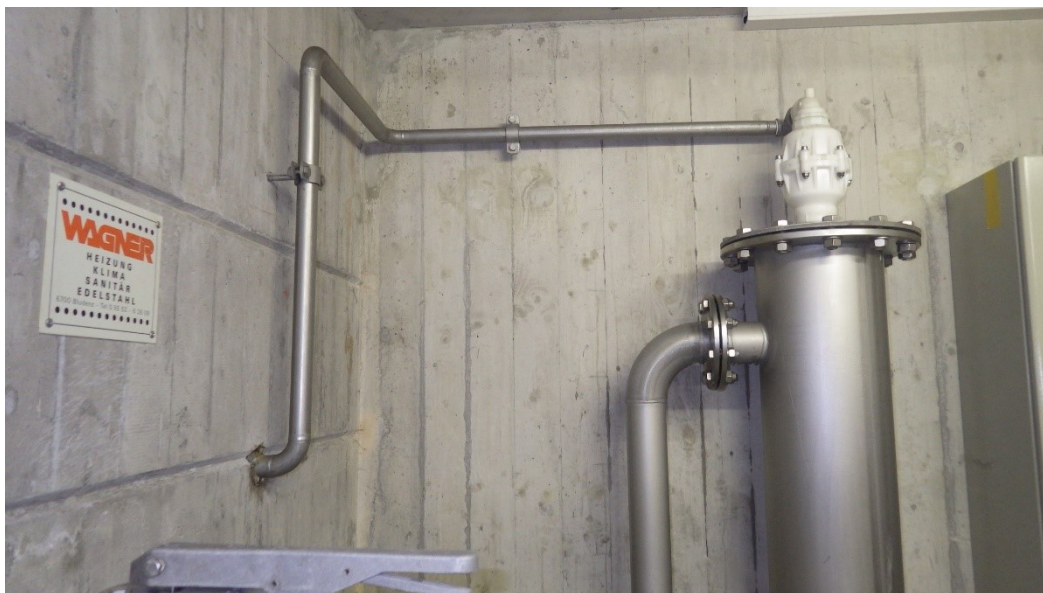
Entlüftung in Wasserkammer - kritisch