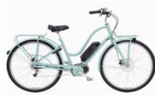
ELECTRA Townie GO - MITTELMOTOR BOSCH Performanceline

Bei einer kurzen Testfahrt beim Fahrradhändler sind oft nicht alle Fragen zufriedenstellend zu klären. Im Rahmen der Testaktion MitarbeiterInnen verschiedene Elektroräder kostenlos eine Woche zum Testen ausleihen