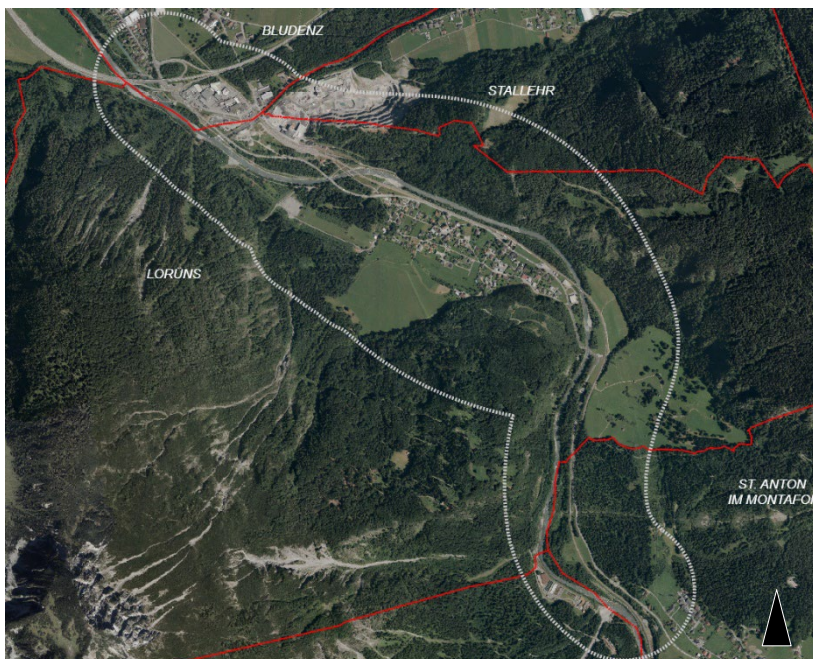
Abbildung 2: Darstellung des Untersuchungsraumes: grau punktierte Linie; rot: Gemeindegrenzen